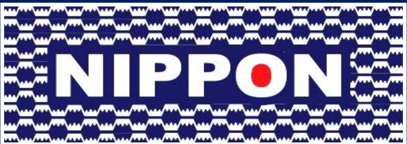
「NIPPON」 喜多屋商店 : 森本圭