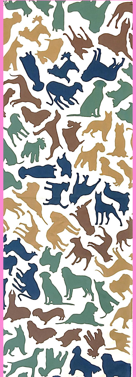
- 犬づくし - 『Alnico Indigo』一瀬宗也

ものづくり浜松を代表する注染の職人3人による オリジナルデザインてぬぐいを展示販売します