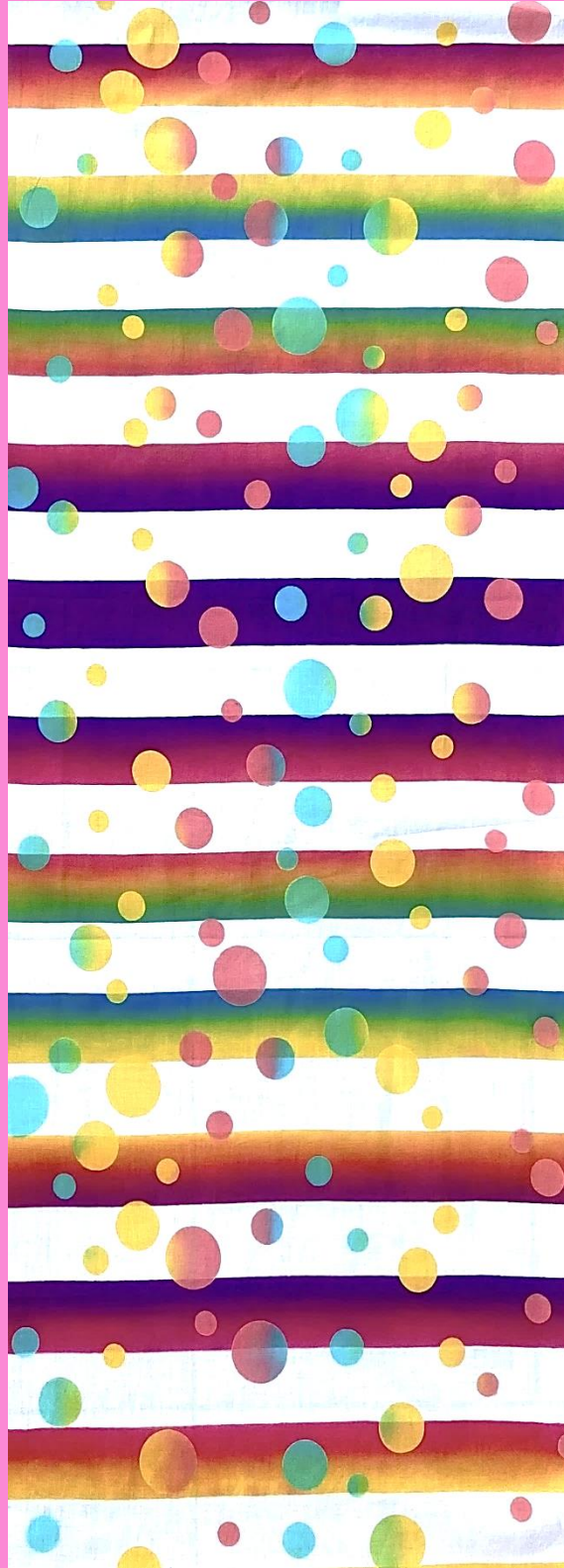
- ロリポップキャンディ - 泡沫の虹・うたかたのにし 『喜多屋商店』森本圭